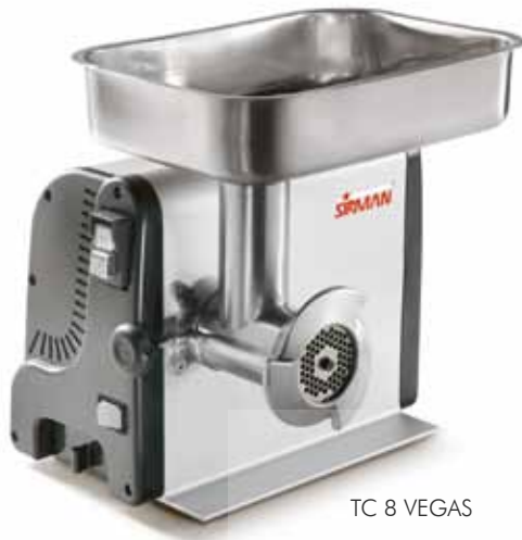
TC 8 VEGAS