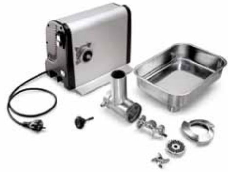
方便拆卸,易于清洁